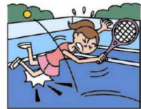
●スポーツ中のケガ