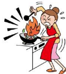
●家庭内での思わぬケガ