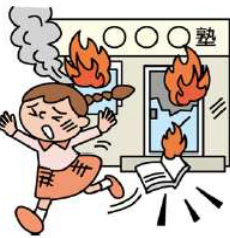
●学校・塾などでのケガ