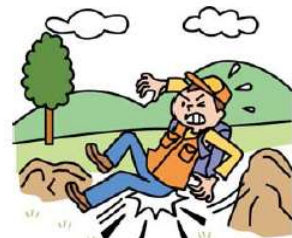
●レジャーでのケガ