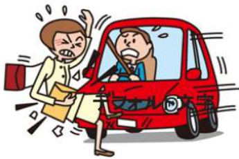
●交通事故によるケガ