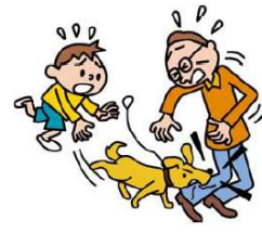
●飼い犬が他人に噛みつきケガを負わせた