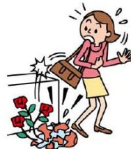
●買い物中に商品を壊した